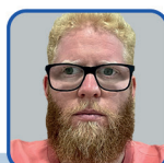
DIR. DE COMUNICAÇÃO: THIAGO HENRIQUE COSTA SOUSA